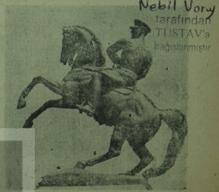
Nebil Vory tarafından TUSTAV'a bağışlanmıştır